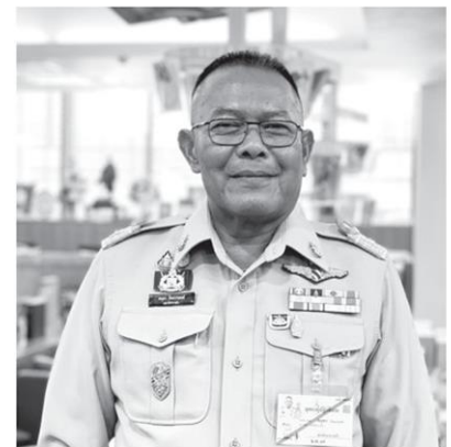
โดยคณะทำงานจะนำหมนำหลักการทรงงาน หลักปรัชญาของเศรษฐกิจ

ร่องขุยพร้อมระบบส่งน้ำอันเนื่องมาจากพระราชดำริ จังหวัดพะเยา โครงการเขื่อนป่าสักชลสิทธิ์ จังหวัดลพบุรี โครงการพัฒนาแหล่งน้ำสองฝั่งลำน้ำชีอันเนื่องมาจากพระราชดำริ จังหวัดชัยภูมิ และโครงการอาคารอัดน้ำบ้านเนินทองพร้อมระบบส่งน้ำอันเนื่องมาจากพระราชดำริ จังหวัดระนอง